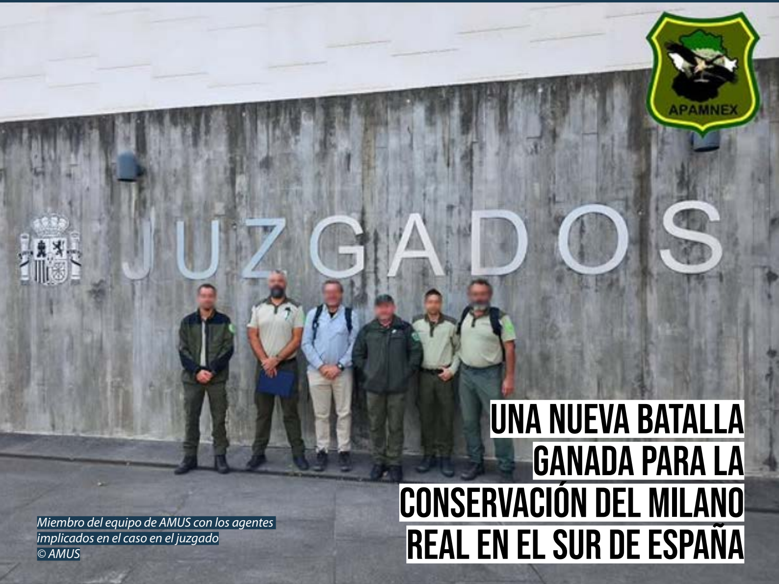
Miembro del equipo de AMUS con los agentes implicados en el caso en el juzgado