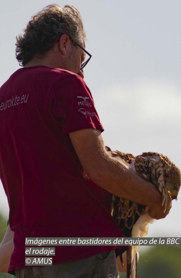
Imágenes entre bastidores del equipo de la BBC durante el rodaje.