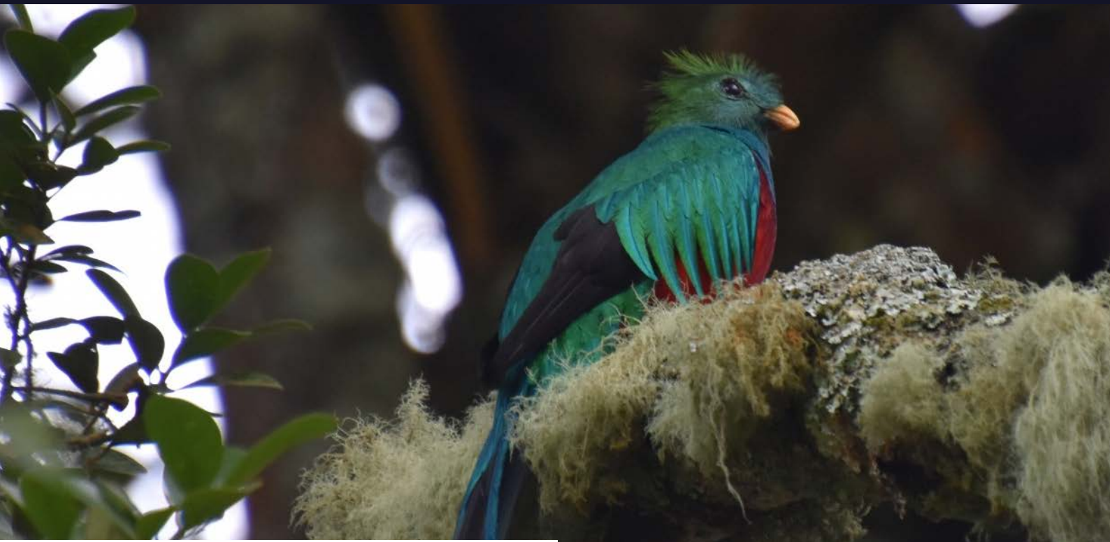
Un Quetzal (también llamado el pájaro de los dioses)