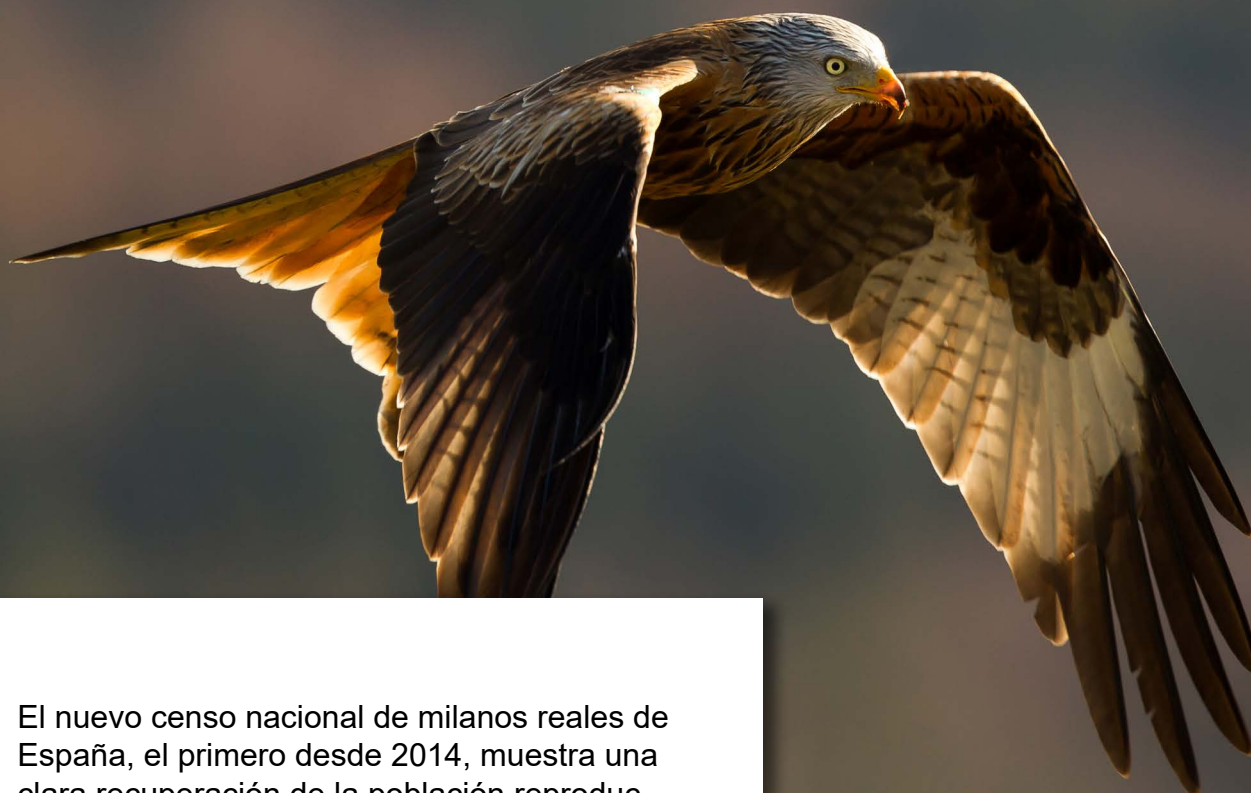
Milano real

El nuevo censo nacional de milanos reales de España, el primero desde 2014, muestra una clara recuperación de la población reproductora. La estimación preliminar registra \geq 3.199 parejas reproductoras, lo que refleja un aumento del 32-39 % en la última década. También confirma el regreso de la especie a zonas de las que había desaparecido casi por completo, como Castilla-La Mancha, Madrid y las Islas Baleares, donde los esfuerzos de conservación han propiciado un notable repunte. Castilla y León continúa siendo el principal bastión, con más del 50 % de todas las parejas, seguida de importantes poblaciones en Navarra, Extremadura y Aragón. La distribución refleja en gran medida los censos anteriores, con las concentraciones principales en el centro-oeste y a lo largo del corredor sur de los Pirineos-valle del Ebro.