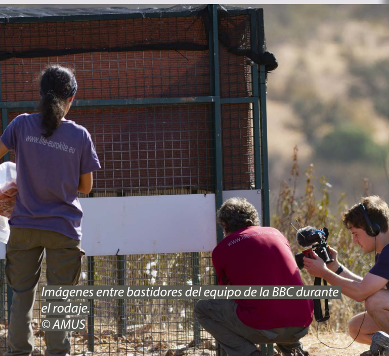
Imágenes entre bastidores del equipo de la BBC durante el rodaje.