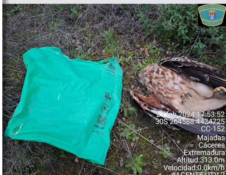
Milano real envenenado

21 feb 2024 17:53:52 30S 264588 4424725 CC-152 Majadas Cáceres Extremadura Altitud: 313.0m Velocidad: 0.0km/h #AGENTE LITV 2